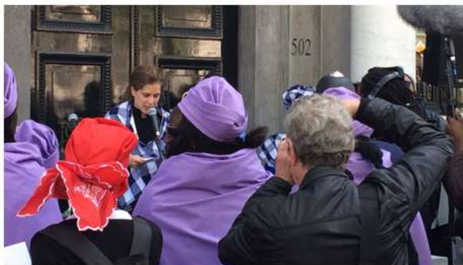
Juni is de Keti Koti-maand en staat in het teken van de herdenking van het slavernijverleden en de viering van de afschaffing daarvan op 1 juli 1863.